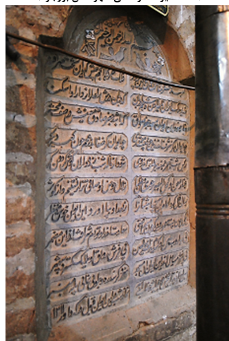
تصویر ۱۳. لوحه سنگی در ایوان مسجد تابستانه از نمای جانبی