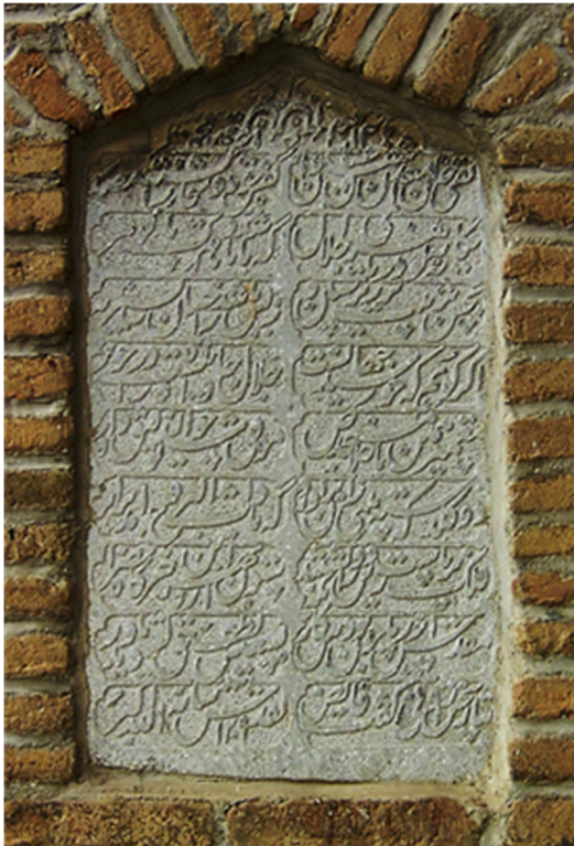
تصویر ۷. کتیبه پایه شرقی ایوان غربی مسجد جامع بروجرد

دستور او تجدید بنا و یا تعمیر شده است. بر بالای درگاه، بر سنگی این اشعار مشاهده می‌شوند: