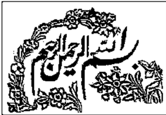
تصویر ۱۴. طرح تزئینات بالای لوحه سنگی درگاه مسجد