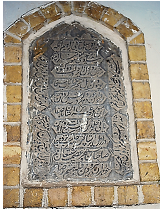
تصویر ۱۰. لوحه سنگی نصب‌شده در ورودی مقبره دوخواهران

۱- لوحه سنگی درگاه جنوب غربی مسجد جامع: لوحه‌ای سنگی بر پیشانی درگاه جنوب غربی قرار دارد که متن آن متضمن قصیده‌ای در خصوص بانی، طراح مسجد و سال ساخت شبستان، تخلص شاعر قصیده (سراج) و در پایان ماده تاریخ و تاریخ ساخت است. شرح کتیبه: