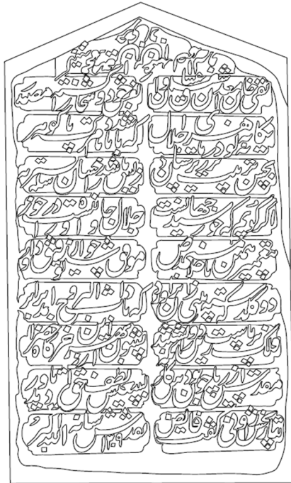
تصویر ۸. طرح کتیبه پایه غربی ایوان غربی مسجد جامع بروجرد