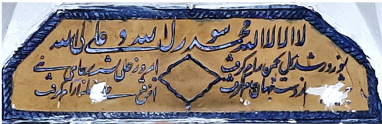
تصویر ۹. لوحه گچی در محراب مسجد امام بروجرد

در مساجد امام بروجرد، کتیبه‌های زیادی وجود دارد؛ اما تنها در ایوان جنوبی آن، بر روی محراب گچی شبستان جنوبی که دارای طاق مقرنسی بسیار زیبایی است، کتیبه‌های گچی به خط کوفی تزئین شده است. محراب شبستان جنوبی با ابعاد ۵×۴ متر و عمق ۲/۶۰ با مقرنسی گچی بسیار زیبا و کاشی‌های خشتی، کتیبه‌های گچی مزین به خط کوفی و اسماء متبرکه که الله، محمد، علی فاطمه، حسن، حسین بلغ العلی بجماله است و نیز اسم