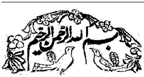
تصویر ۱۵. طرح تزئینات بالای لوحه سنگی ایوان مسجد تابستانه (مأخذ: نگارنده)