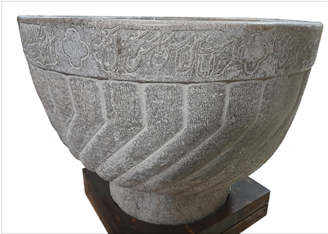
تصویر ۱۵. سنگاب مسجد ناسکدین در محل اداره میراث فرهنگی، صنایع دستی و گردشگری شهرستان بروجرد نگهداری می‌گردد