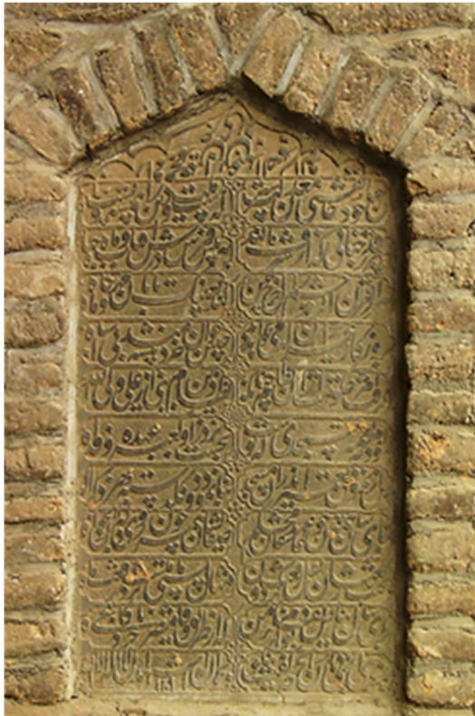
تصویر ۵. کتیبه پایه شرقی ایوان غربی مسجد جامع بروجرد