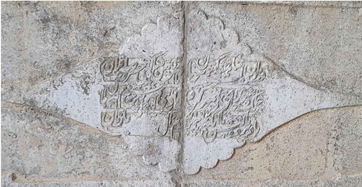
تصویر ۴. کتیبه تعمیر سنگ چاه در درگاه غربی