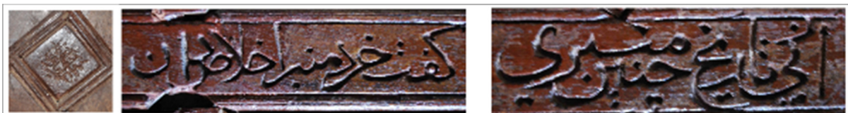
تصویر ۳. ماده تاریخ منبر چوبی و امضای یار محمد نجار