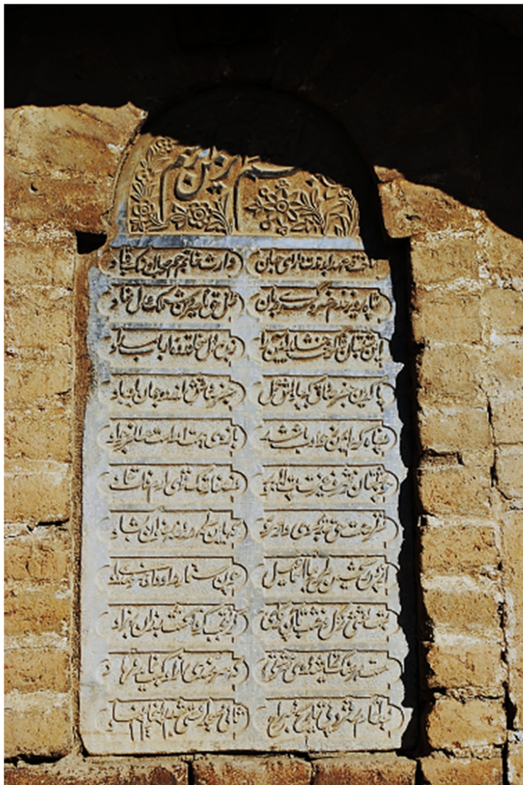
تصویر ۱۱. لوحه سنگی بالای ورودی درگاه جنوبی