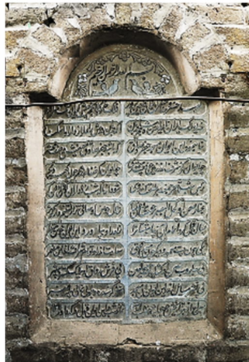
تصویر ۱۲. لوحه سنگی در ایوان مسجد تابستانه