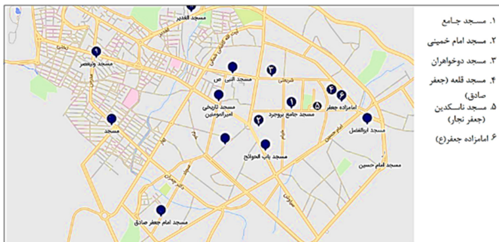
تصویر ۱. موقعیت مساجد مطالعه شده در شهر تاریخی بروجرد در نقشه هوایی.

است (Blair, 1994:4-9). علاوه بر این، محققین نیز به کتیبه‌های مساجد امام و جامع اشاره نموده‌اند (ایزدپناه، ج ۲، ۱۳۵۵ و مولانا بروجردی، ۱۳۵۳، غلامرضا عزیزی، ۱۳۸۳). در مقاله‌ای با عنوان «بازخوانی سیر تحولات مرمت و توسعه مسجد جامع بروجرد»، در این رابطه به برخی از کتیبه‌های شعر استناد شده است (سجادی، ۱۳۹۸). گودرزی در مقاله‌ای با عنوان «بررسی شرایط سیاسی-اجتماعی بروجرد در دوره قاجار، با اتکا به تحلیل کتیبه‌های مسجد سلطانی» به بررسی شرایط سیاسی-اجتماعی بروجرد در دوره قاجار پرداخته است (گودرزی، ۱۳۹۱: ۱۷۳-۱۹۱). مقاله «تحلیل و بررسی تزئینات معماری مسجد جامع شهرستان بروجرد» (اقبالی و خوش‌رو، ۱۳۷۷) به کتیبه ایوان مسجد جامع اشاره کرده، اما تاریخ آن را ۱۰۶۸ هجری نوشته و در خوانش تاریخ دچار اشتباه شده است. در طرح پژوهشی «مطالعه مساجد تاریخی بروجرد (از لحاظ نوع، ساختار و ویژگی‌های معماری و تاریخی)» به مطالعه برخی از کتیبه‌های مسجد بروجرد مبادرت شده است (سجادی، ۱۳۹۶). با این حال، در این مقالات نیز به‌طور کامل به بازخوانی کتیبه‌های شعر مساجد بروجرد پرداخته نشده است و در مجموع، پژوهش جامع و قابل توجهی در این رابطه تاکنون منتشر نشده است.